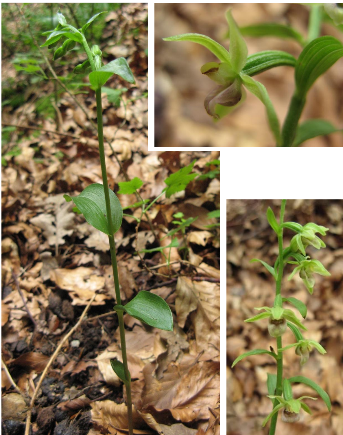
Epipactis exilis : port de la plante en boutons et inflorescence.

d'introduction récente, soit, plus vraisemblablement parce qu'elle était passée inaperçue, ses sites étant difficiles d'accès et peu fréquentés. En outre, il est possible que la plante ne fleurisse pas les années sèches.